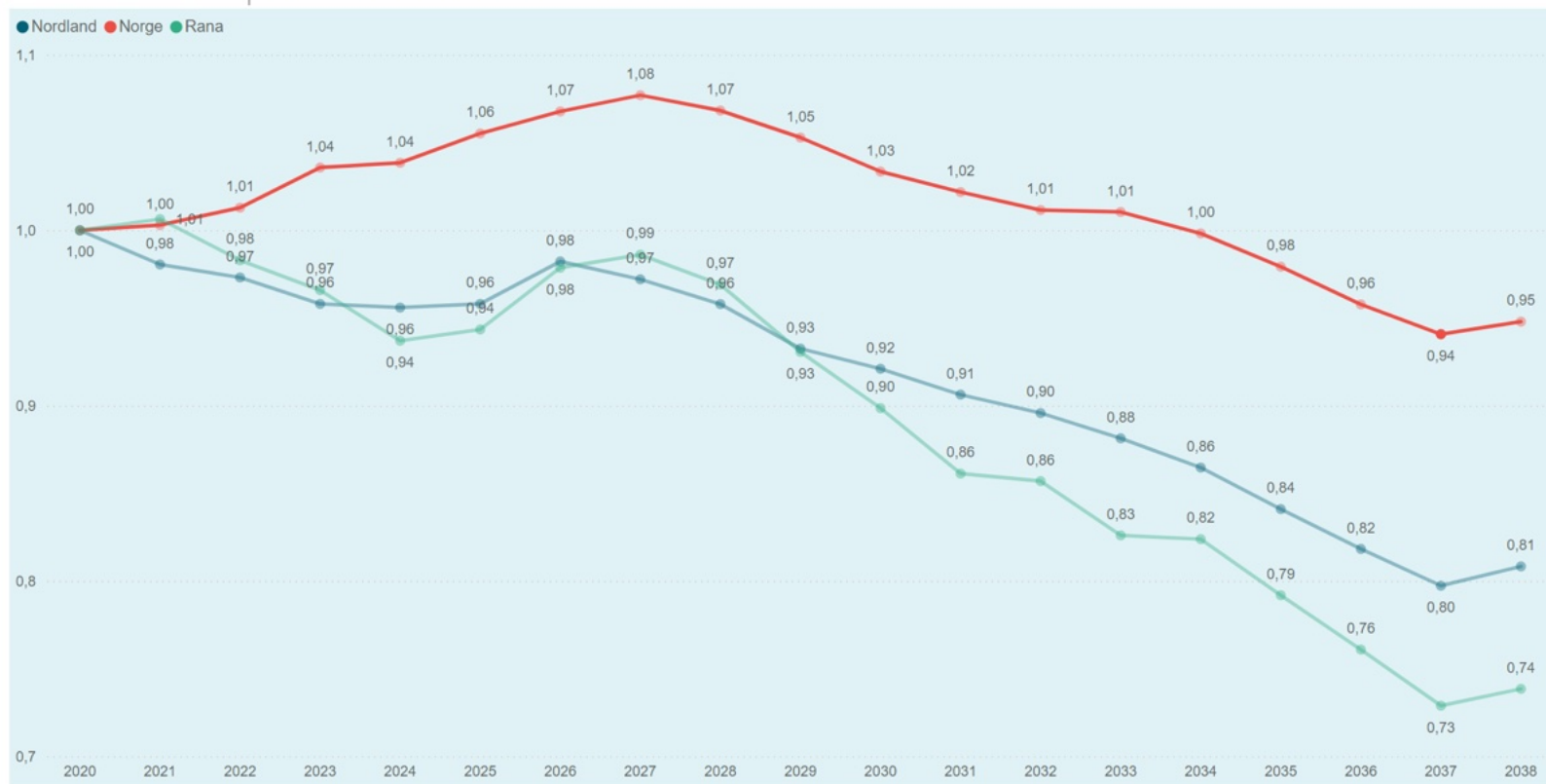
Søkergrunnlag VG1 ved Polarsirkelen videregående skole